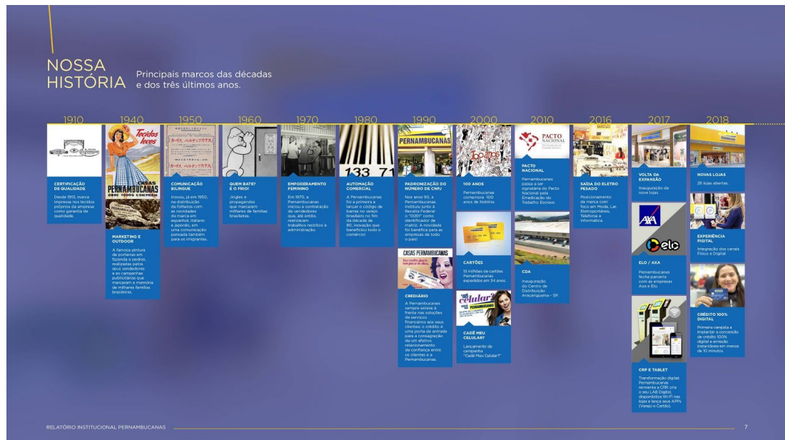
FIGURA 3: Linha do Tempo Pernambucanas