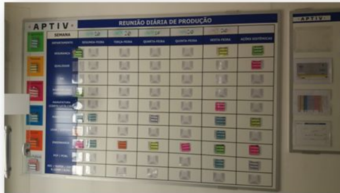
(Imagem 03 - APTIV - Reuniões diárias)

Nessa sala também acontece a APTIV de Portas Abertas, onde trimestralmente são realizadas reuniões de diversos setores com a alta gerência para conversarem sobre assuntos destinados ao ambiente de trabalho.