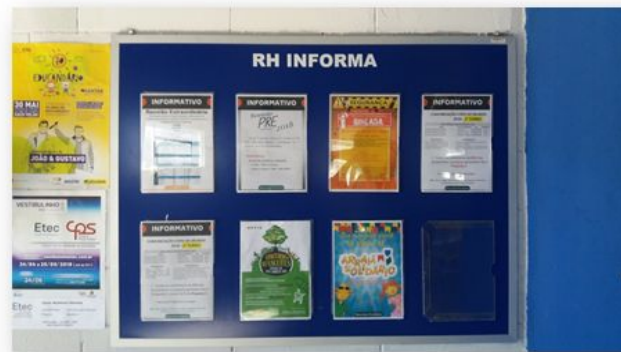
(Imagem 01 - APTIV - RH INFORMA)