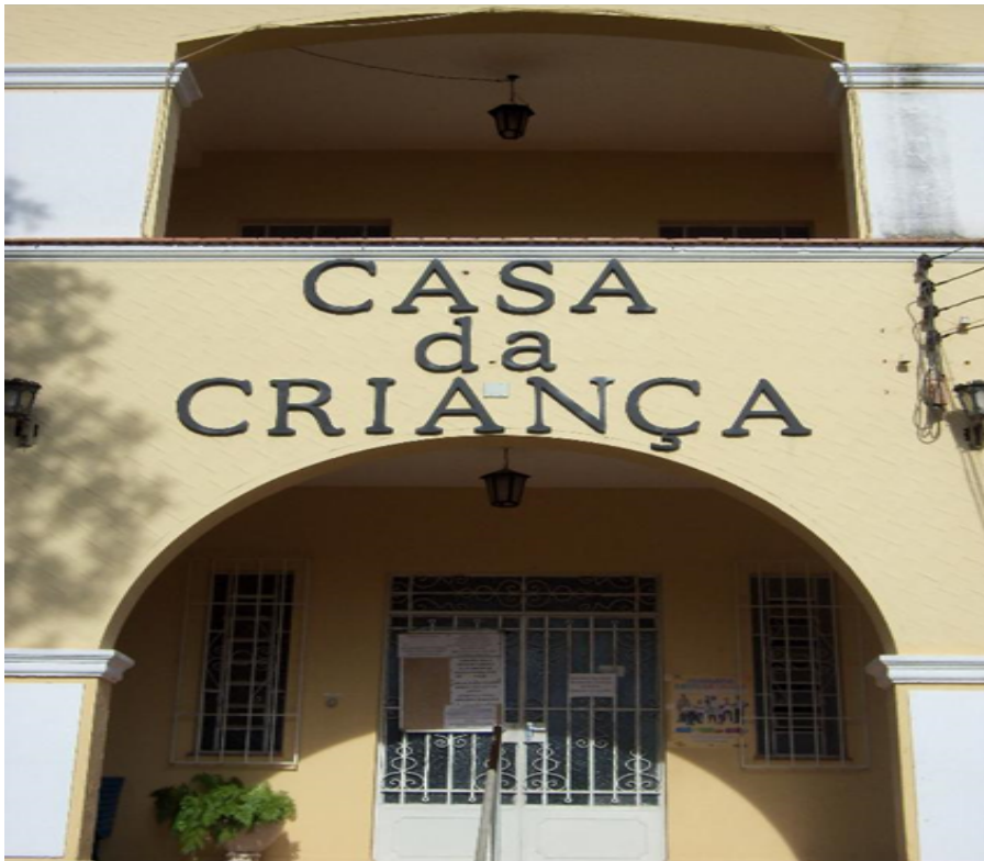
IMAGEM 1 - Fachada frontal Casa da Criança

A CASA DA CRIANÇA CRECHE ESCOLA DE EDUCAÇÃO INFANTIL portadora do CNPJ: 59.765.628/0001-20 e situada na Av. João Osório, 396- Centro, São João da Boa Vista- SP no cep:13870-251, foi fundada em 24 de Maio de 1942, por três senhoras da sociedade sanjoanense, cujo objetivo era amparar crianças carentes. O objetivo da creche é amparar a criança durante o período em que a mãe está trabalhando fora, segue abaixo imagem frontal da Casa da Criança ( IMAGEM 1 ).