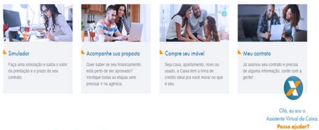
Figura 01 – proposta minha casa minha vida

A seguir imagens dos principais projetos, como minha casa minha vida, projeto de (habitação), crédito rural, empréstimo pessoal, financiamento estudantil e etc.