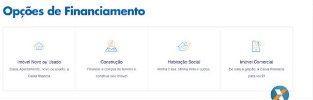
Figura 02 – Opções de pagamento