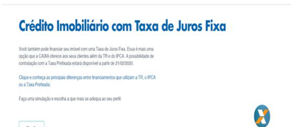
Figura 03 – Crédito imobiliário