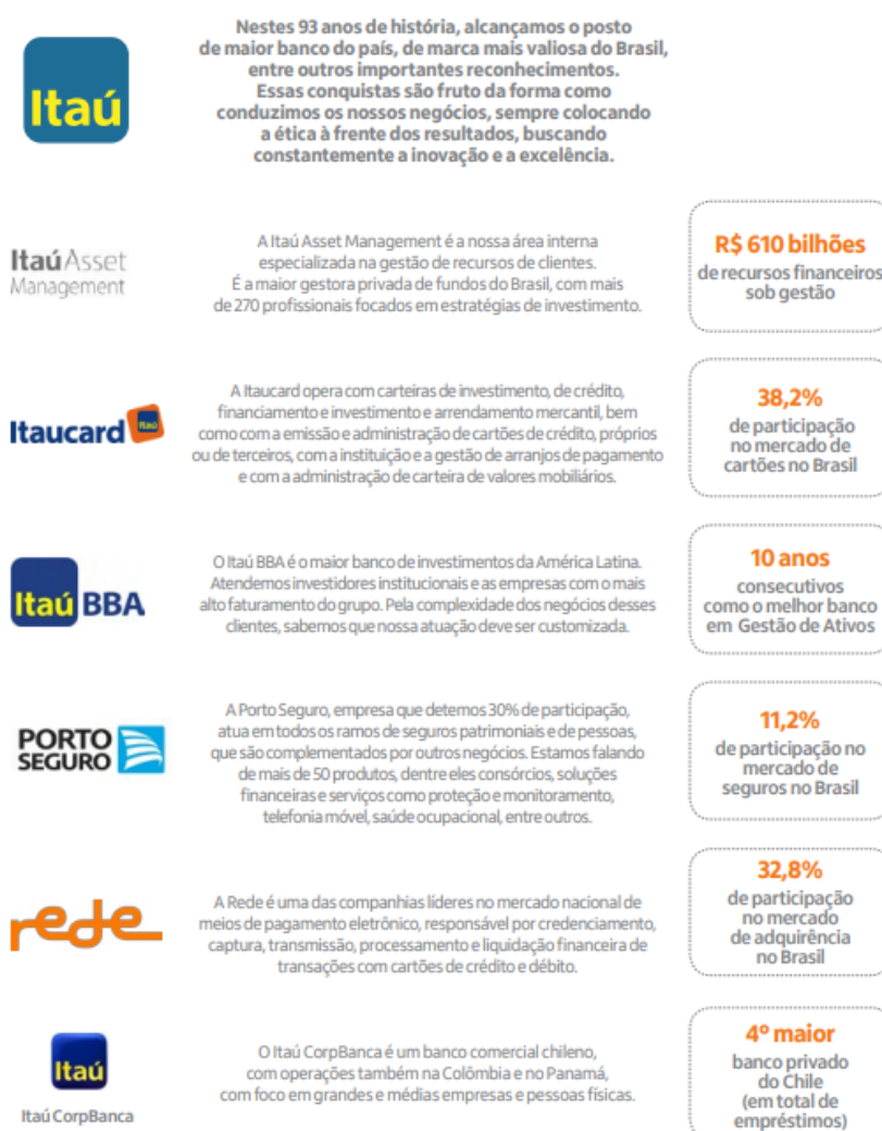
Figure 03 - Principais Marcas e Parcerias

Na figura 03 será apresentada as principais marcas e parcerias do Banco Itaú.