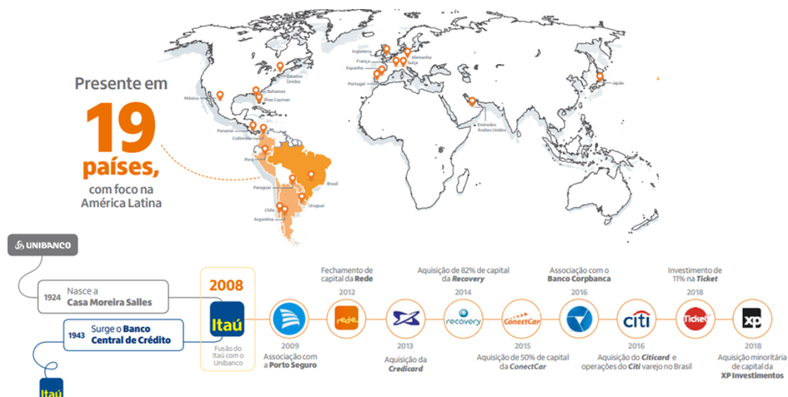
Figure 01 - Presença Internacional