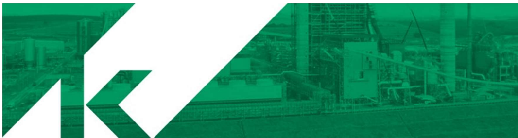
Figura 3: Cabeçalho Klabin

Em 1902 arrendaram a Fábrica de Papel Paulista e começaram a produzir papel, e em breve estava entre as três maiores fábricas deste setor no país. A partir do ano de 1931 até os dias de hoje, a Klabin não parou de crescer e inovar, e hoje conta com 19 unidades industriais, sendo 18 no Brasil, em nove estados, e uma na Argentina. Possui três unidades florestais, sendo no Paraná, em Santa Catarina e em São Paulo. Mantém também 14 escritórios distribuídos em várias regiões do Brasil.