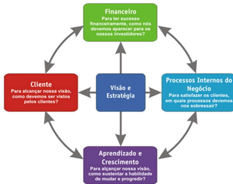
Figura 4: Ciclo Visão e Estratégia