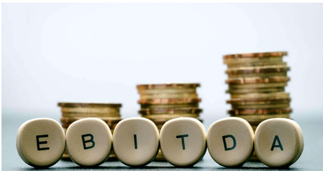
Figura 5: EBITDA

É muito interessante analisar a competitividade e a eficiência da empresa, principalmente em comparação ano a ano e com os concorrentes, por exemplo, duas empresas de países diferentes podem ser postas lado a lado em uma planilha sem interferências dos juros altos que uma paga ou dos impostos mais baixos da outra.