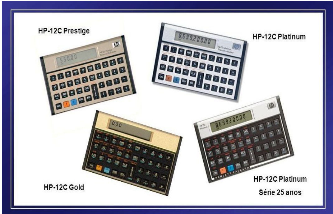
Imagem I - Modelos Calculadora HP12C