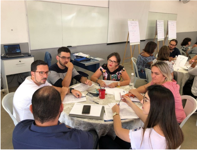
Formação em Liderança Horizontal - Instituição: IMO Brasil