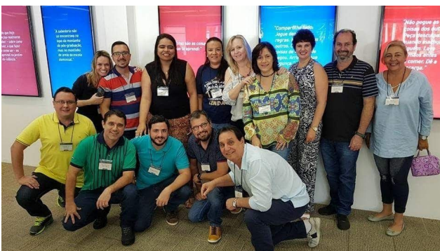
Treinamento "Programa de Gestão Avançado" na instituição Amana-key