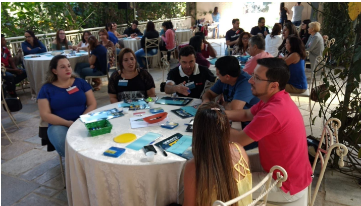
O jeito Unifeob de Encantar