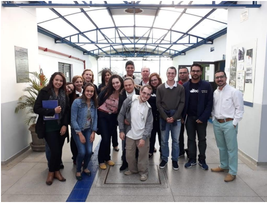
Treinamento de Melhoria Contínua - Turma 1