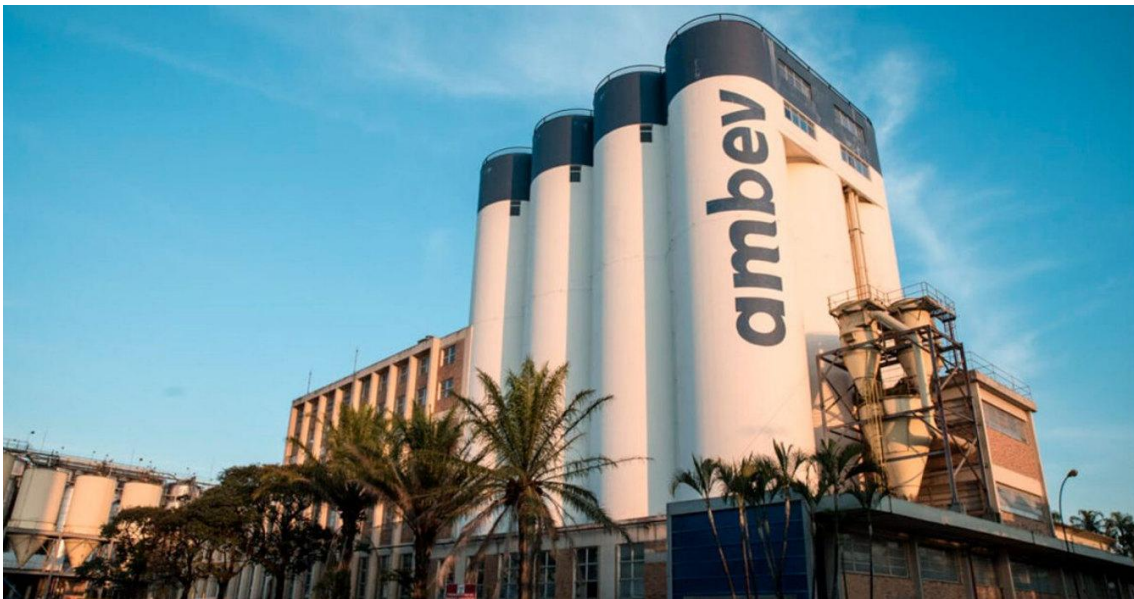
Foto da Ambev localizada em São paulo.