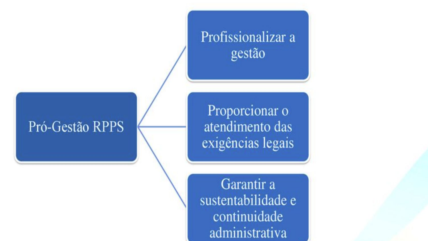
Figura 1 - O que o Pró - Gestão RPPS busca.

Com essa grande responsabilidade foi estabelecida uma certificação chamada de Pró-Gestão, monitorando se ocorre as boas práticas da gestão previdenciária, apesar da adesão ser facultativa, o programa visa incentivar os Regimes Próprios de Previdência Social a transparecer de maneira positiva suas ações, fortalecendo o relacionamento com os segurados e a sociedade (ECKERT, 2019, p. 29).