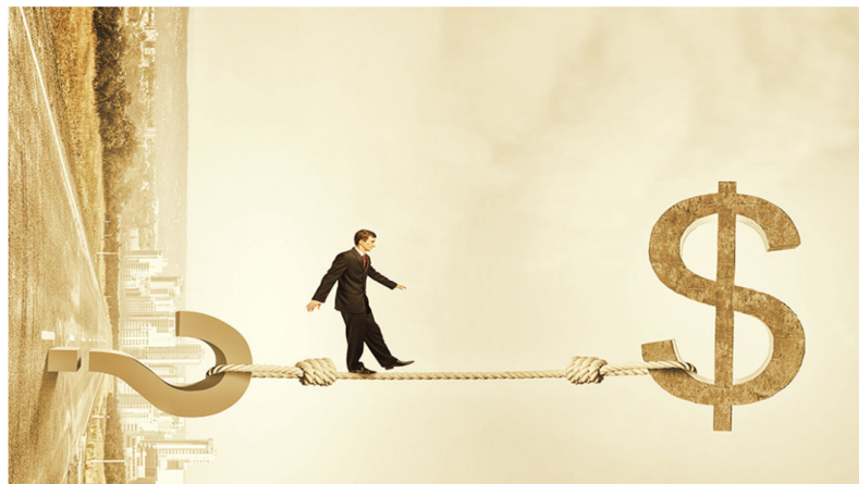
Figura 3:

A avaliação de risco e retorno é essencial para equilibrar uma carteira de investimentos em uma empresa.