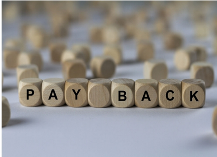
Figura 4: Payback

Iremos conceituar Payback e descrever suas principais características.