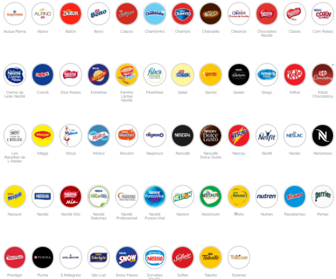
Imagem 06 - Portfólio de marcas Nestlé.