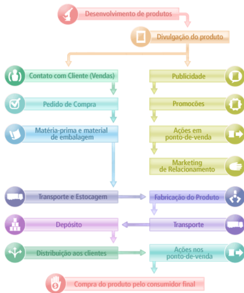
Imagem 07 - Cadeia de Logística Nestlé.