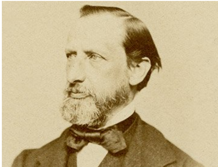
Imagem 03 - Foto fundador da organização Nestlé, Henry Nestlé.