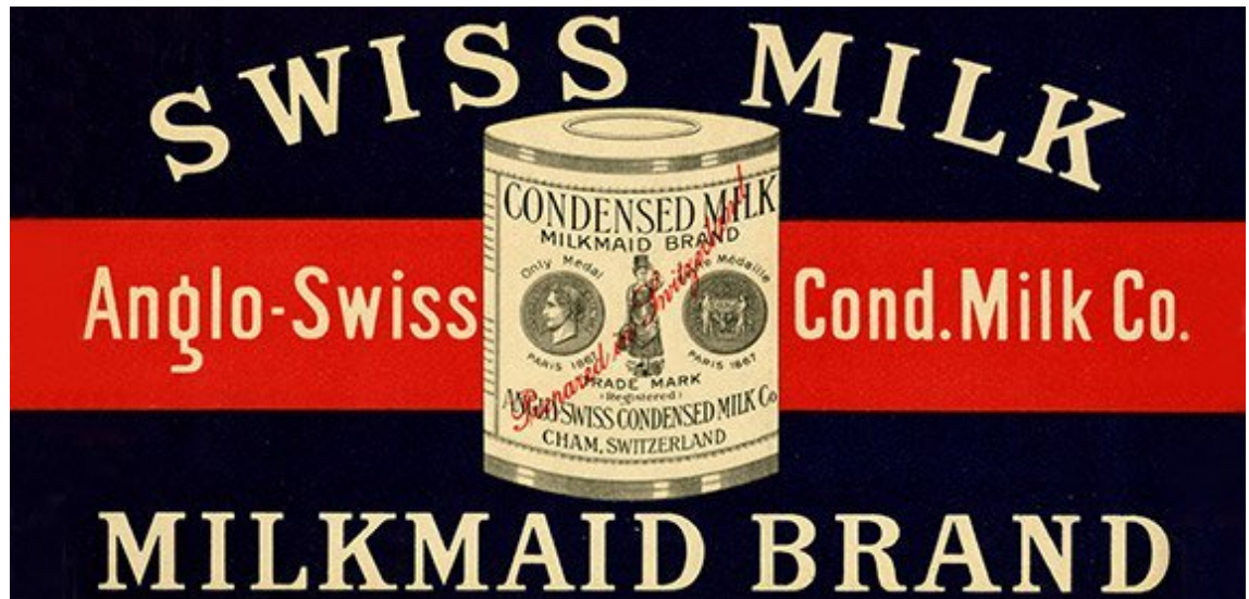
Imagem 01-Leite Condensado produzido por Swiss Milk em 1866.