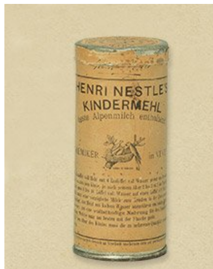
Imagem 02 - Primeira embalagem Farinha Láctea, produzida por Henry Nestlé.