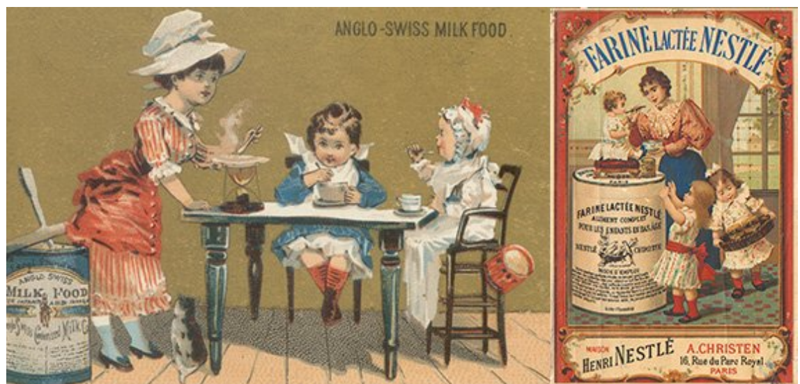
Imagem 04 - Propaganda dos produtos similares de Henry Nestlé e Anglo Swiss.