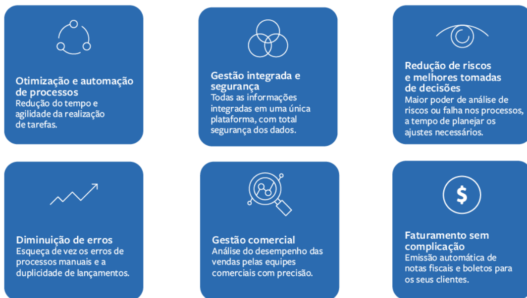
Imagem 2: Principais vantagens de usar no ERP