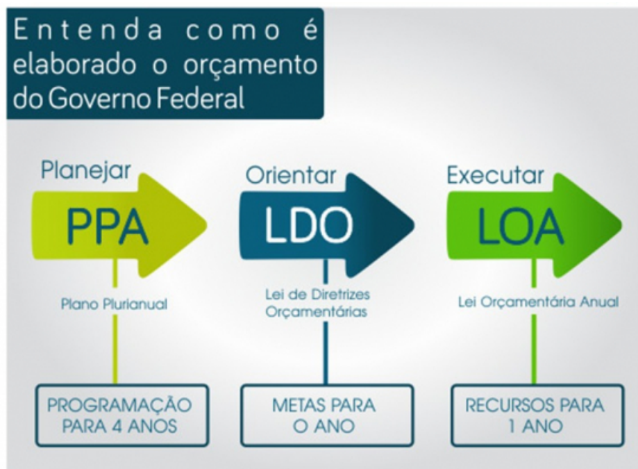
Fluxograma 2: Leis Orçamentárias PPA, LDO e LOA