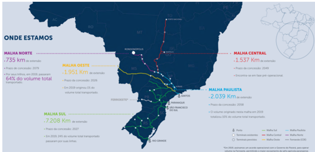
Figura 02 - Expansão Geográfica