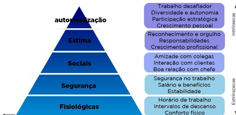
Imagem 4. Motivação no trabalho e a pirâmide de maslow Disponível em: https://penser.com.br .

Agora podemos utilizá-la no contexto profissional e motivacional do trabalho, relacionando as nossas necessidades básicas em conjunto com o comportamento humano nas organizações.