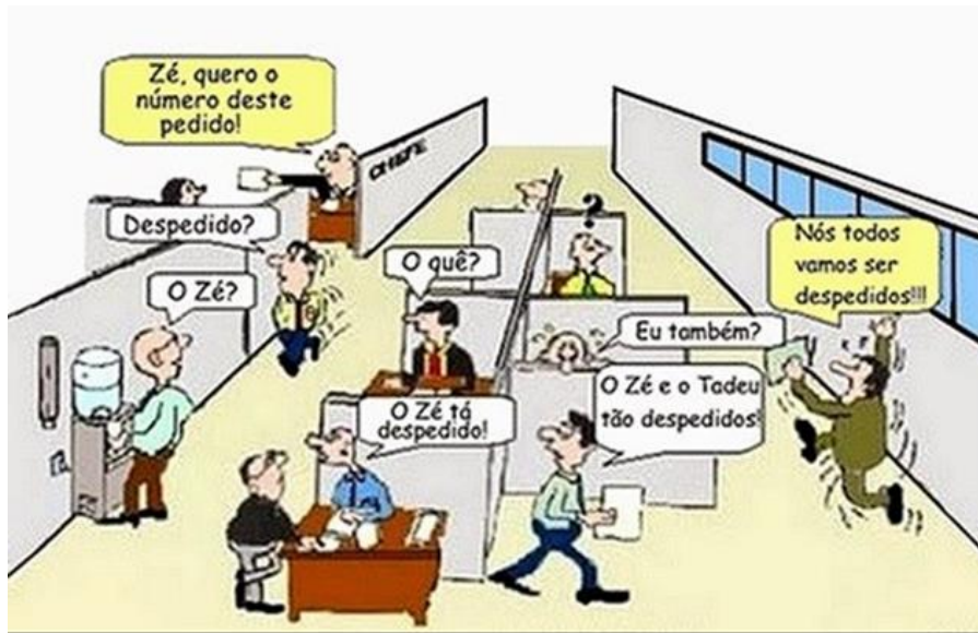
Imagem 2: Comunicação do ambiente organizacional

Contudo, é necessário que a comunicação seja objetiva para que todos que estejam recebendo a informação possam entender com clareza. Desta forma é necessário escolher o canal de comunicação que mais se adequa à informação e o momento certo de repassá-la para todos. A fim de fortalecer a cultura da empresa, redução de rotatividade de colaboradores, redução de conflitos, aumento de produtividade e melhor clima organizacional.