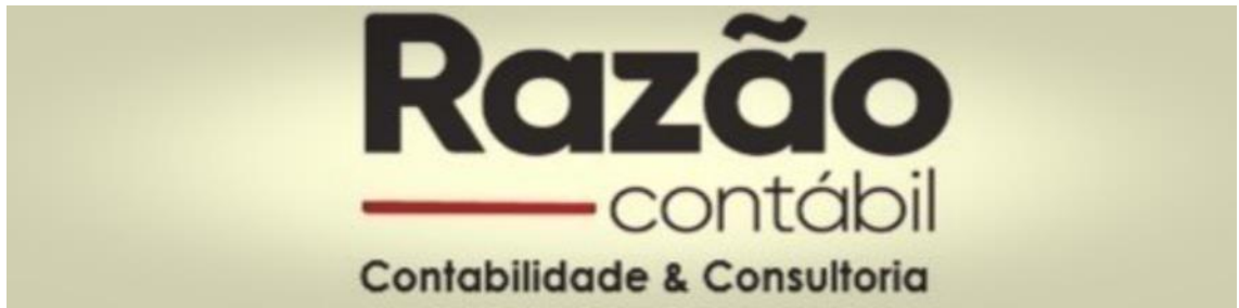
Imagem 2: Logotipo empresa Razão Contábil

Hoje o escritório conta com 3 colaboradores e presta serviços de assessoria e consultoria para empresas de médio e grande porte, com tributação em lucro real, presumido e simples. Apesar de contar com poucos funcionários, o escritório possui uma mentalidade inovadora e empreendedora. Diferente dos escritórios convencionais de contabilidade, a equipe Razão Contábil atua de forma integrada com as empresas que atendem, estreitando laços e fortalecendo a cultura da confiança e integridade, buscando sempre trabalhar de forma orgânica, onde as relações interpessoais são em níveis horizontais, com foco no trabalho em equipe colaborativo entre todos, valorizam o ambiente de trabalho, cordialidade e educação.