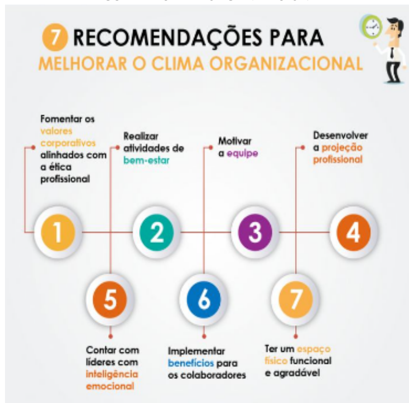
FIGURA 1 - CLIMA ORGANIZACIONAL

Maximiano (2009) afirma que o Clima Organizacional em essência é uma medida de como as pessoas se sentem em relação à empresa e seus administradores, tendo seu conceito evoluído para o conceito de qualidade de vida no trabalho.