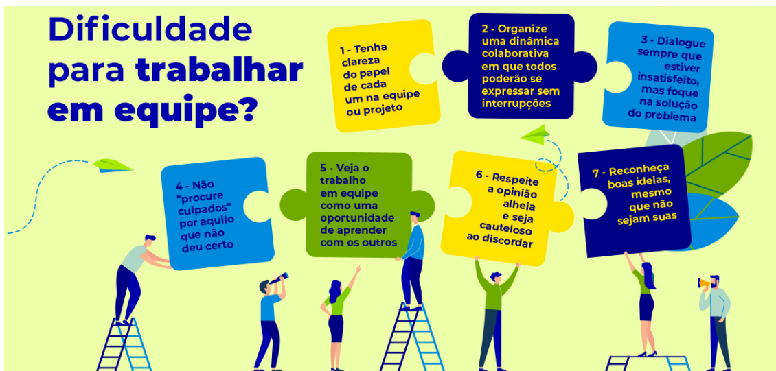
FIGURA 2 - TRABALHO EM EQUIPE