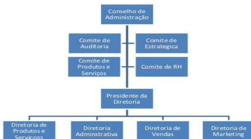
Figura da Estrutura Organizacional:

A estrutura organizacional da Lojas Marisa, consiste no modelo de Assessoria. Esse modelo tem como finalidade uma assistência realizada por um profissional ou uma equipe especializada em uma determinada área de conhecimento (No caso da empresa Marisa, a área do varejo da moda). É composto também de profissionais competentes e bem especializados, aconselhando em uma área específica com clareza.