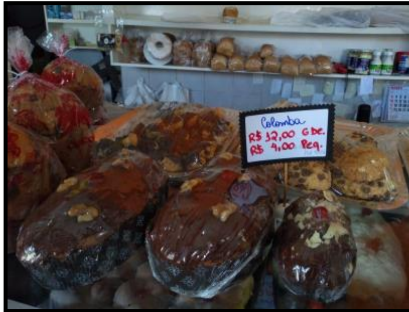
Figura 4: Precificação dos produtos.