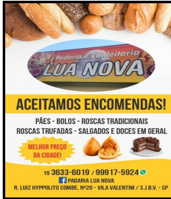
Figura 2: Panfleto.

No dia 18/03/19, foi elaborada a arte do folder e na mesma semana foi feita a impressão na gráfica. No dia 30/03/19 foi a entrega dos panfletos e a precificação dos produtos.