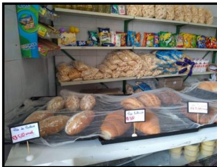
Figura 3: Precificação dos produtos.