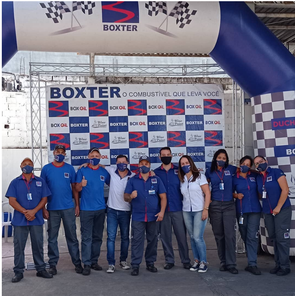
Imagem 3