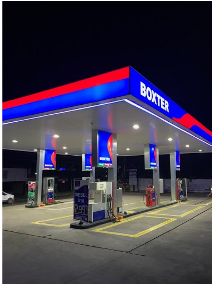
Imagem 1