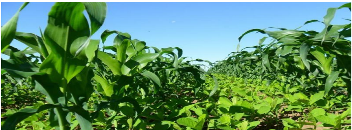
Figura 1: consórcio de milho com 60 dias e crotalária 40 dias

A figura seguinte mostra o plantio consorciado de milho com crotalaria: