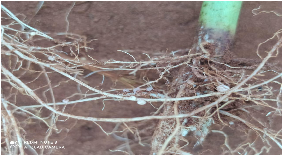
Figura 5: foto ilustrativa de raízes e nódulos de associação simbiótica com rizóbios