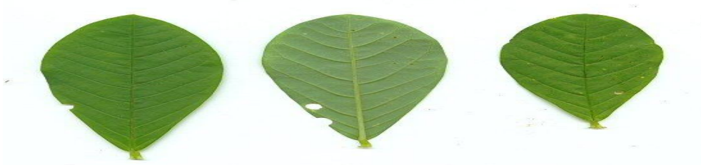
Figura 3: foto ilustrativa de folhas e flores da Crotalaria spectabilis