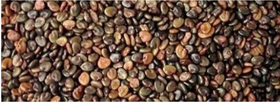
Figura 4: foto ilustrativa de sementes de Crotalaria spectabilis