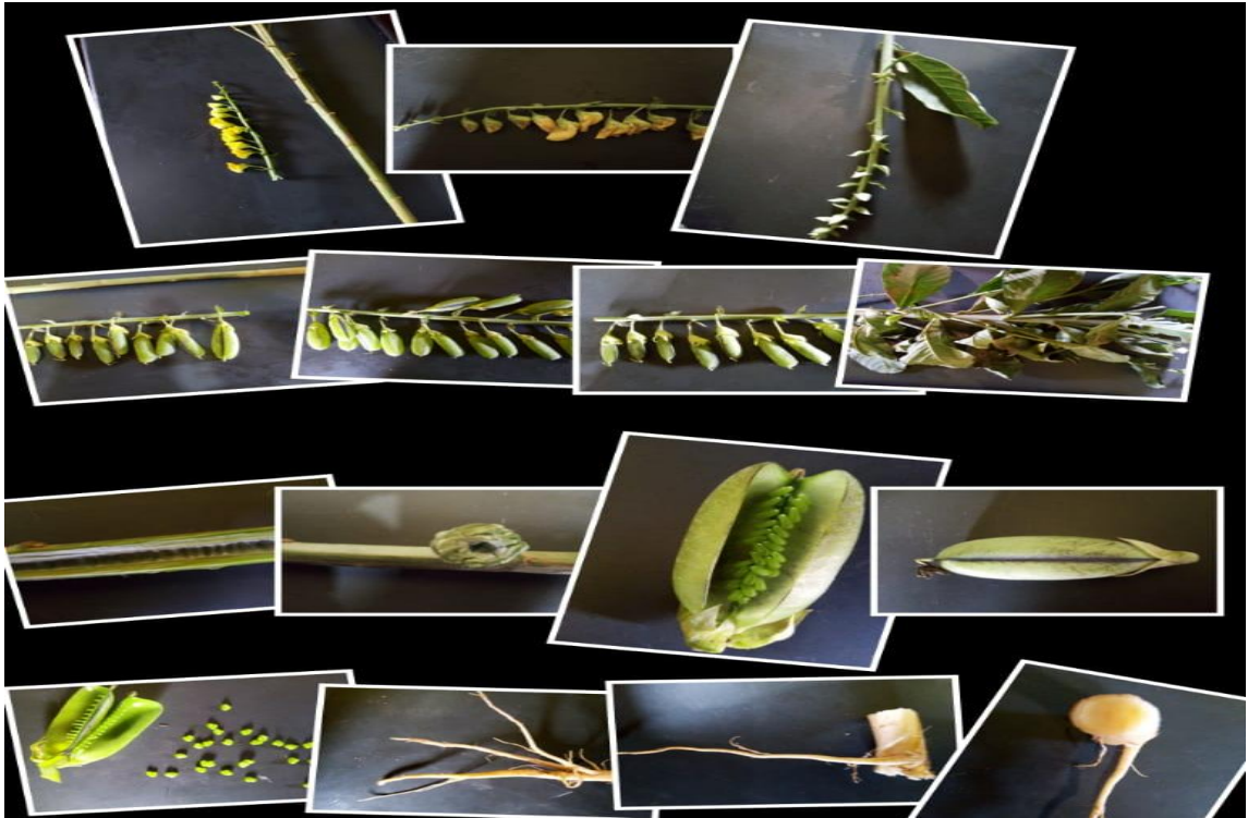
Figura 6: agrupamento de fotos ilustrativas referentes aos ramos foliares, folhas, sementes, vagens