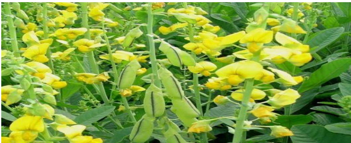
Figura 2: foto ilustrativa das flores e vagens que contém as sementes da Crotalaria spectabilis

A C. spectabilis possui inflorescência racemosa com flores pentâmeras, zigomorfas, dialipétalas e papilionada. Esta leguminosa é uma espécie dióica, com ovário súpero, com anteras dimorfas e deiscência em tempos diferentes, entretanto apresenta protandria parcial. O ovário súpero e a flor monoclina facilitam a autofecundação, uma vez que não há autoincompatibilidade, mas com a detecção de hercogamia têm-se uma barreira física para a autofecundação. Embora apresente um sistema reprodutivo autocompatível, a espécie possui dependência com uma única espécie polinizadora ( Xylocopa sp.) na área de estudo, para a permuta de genes. As abelhas Trigona sp. e Apis mellifera , os lepidópteros e a espécie de beija-flor são considerados pilhadores de néctar e/ou pólen. (HENRIQUE, M.O. e FIGUEIREDO, R.A.).