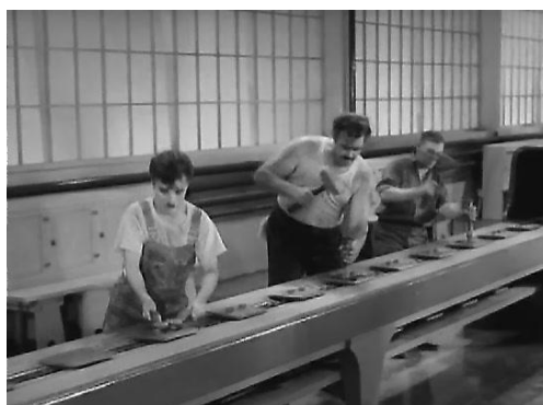
Figura 1 – Tempos Modernos