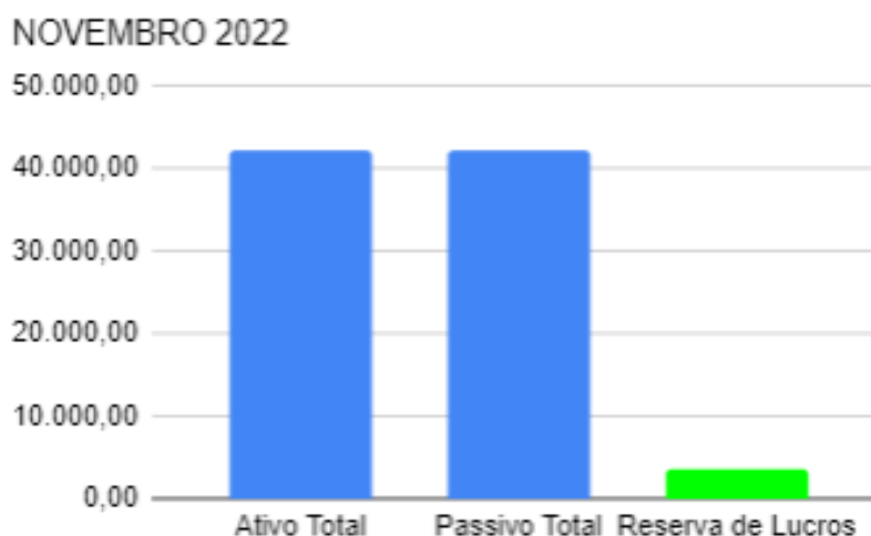
Gráfico 01: Comparação do Balanço sem o Passivo Trabalhista.