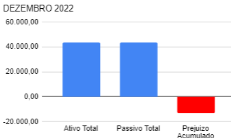
Gráfico 02: Comparação do Balanço com o Passivo Trabalhista