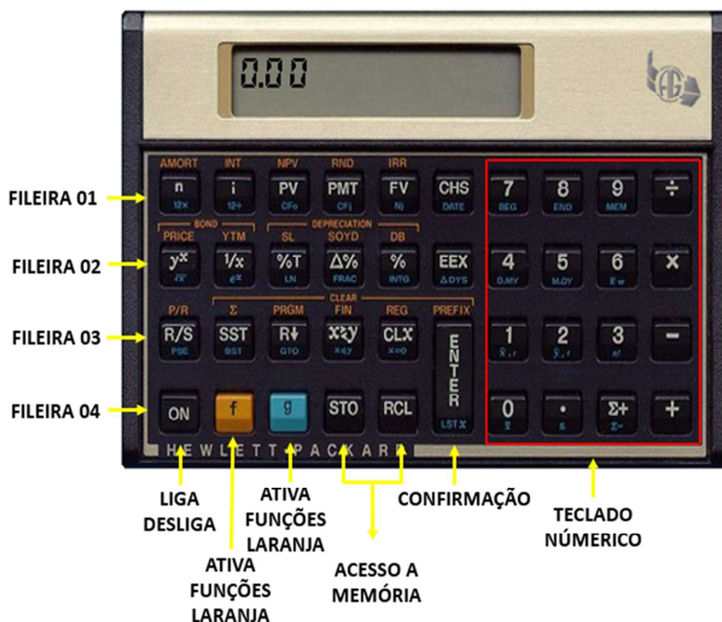
Figura 7 – Interface da calculadora HP 12C.

A calculadora HP 12C, possui três tipos de funções: