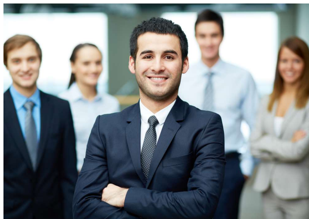
Imagem 13: Motivação

O questionário (anexo 1) foi respondido por um funcionário na função de operador de máquinas, portanto os dados foram levados de forma qualitativa