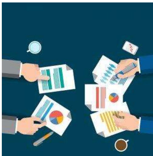
Imagem 9: Planejamento

Resoluções de problemas tem relação com a motivação por meio da necessidade constante da solução na qual funcionários mais satisfeitos solucionam de forma mais eficaz.