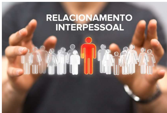
Imagem 2: Relações Interpessoais

Padrões de Relacionamento é a forma como a empresa dirige entre padrões de conflito e competitividade, é o meio entre que haja competição para instigar o funcionário a sempre ser o melhor de seu serviço, mas também sem conflitos, cada um colaborando com a harmonia, tendo em mente que cada um que está naquela empresa tem seu valor e habilidade.