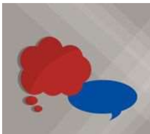
Imagem 5: Padrões de Comunicação

Canais de Comunicação são abertos ou fechados, isto quer dizer se são disponíveis para os funcionários ou se as empresas não são transparentes, contudo é o diálogo e a circulação de acesso às informações.