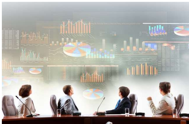
Imagem 8: Tomadas de Decisões

O planejamento em todo sentido é como a empresa organiza e coloca em prática seus meios para se alcançar um objetivo, mas como toda empresa há conflitos e problemas e ela tem que se mostrar objetiva os evitando.