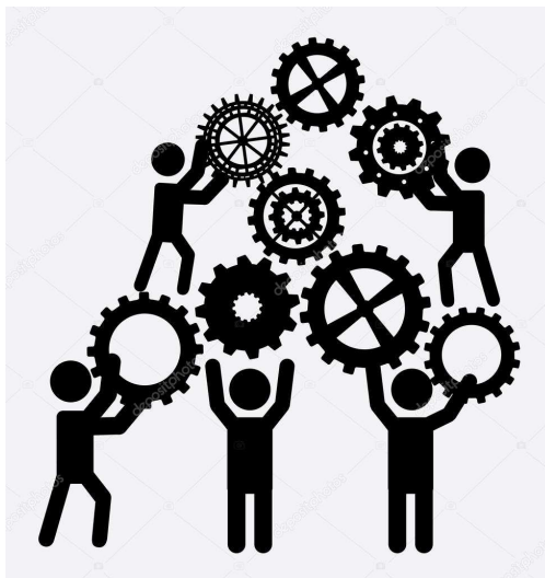
Imagem 11: Trabalho em Equipe

Clima Organizacional é o grau de segurança e o grau de satisfação entre os funcionários. Contudo é o potencial das pessoas que leva a flexibilidade e capacidade de ajustamento dentro da empresa.