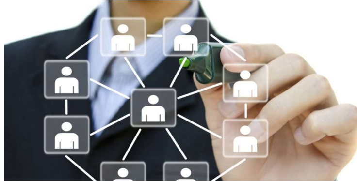
Imagem 12: Clima Organizacional

E por último é a Motivação, ter em si o auto reconhecimento de sua importância dentro da empresa e o lado emocional colocando a si e ao grupo a procura de novos desafios, metas e responsabilidades para o desejo comum, o desenvolvimento a prol da mesma.