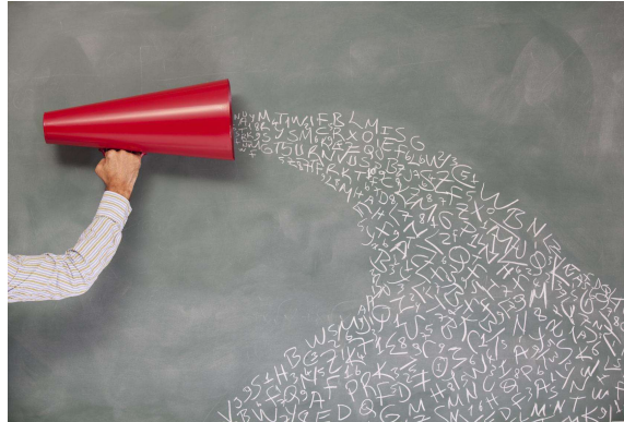
Imagem 6: Canais de Comunicação

Estilos de Liderança é a qualidade das decisões por líderes integrados que prezam a dinâmica entre seu grupo ou por líderes desintegrados, ou seja, que manipulam conflitos para o bem maior da empresa.