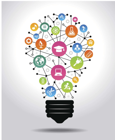
Imagem 10: Resolução de Problemas

Trabalho em Equipe por se dizer é a união do grupo por objetivos em comum, trabalho em equipe integrado, onde todos participam e tem sua opinião e questionamentos ouvidos, ou seja, onde cada um reaprende e ajuda os demais em suas funções.