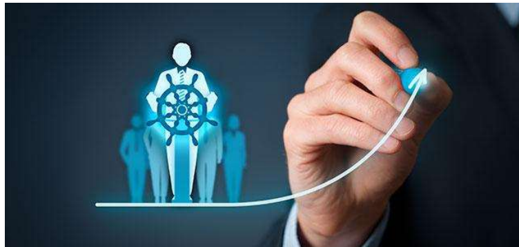
Imagem 7: Liderança

Tomadas de decisões são ocasionais ou aleatórias também permitem a participação em um todo para mostrar que a necessidade do efeito de uma decisão.