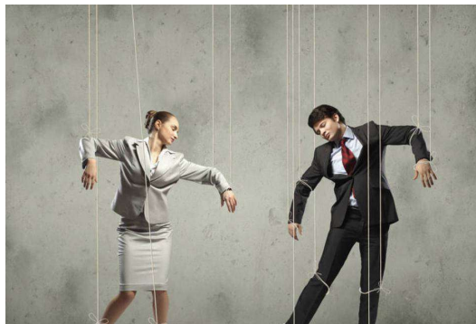
Imagem 1: Tipo de papel rígido

Os tipos de Papéis podem ser classificados em três grupos: Rígido (Excesso de normas e Ausência de impulsos), Permissivo (Excesso de impulsos e Ausência de normas sociais) e flexível (Existência de impulsos e Existência de normas sociais) na qual explica a presença ou não de normas e impulsos.