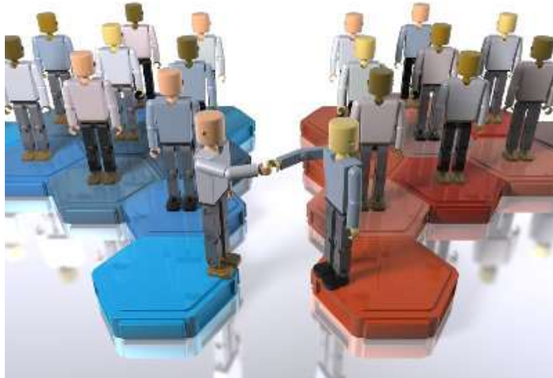
Imagem 4: Relações Intergrupais

Padrões de Comunicação é a informação como matéria prima, à estruturação ou desestruturação de uma empresa.