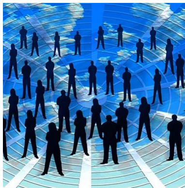
Imagem 3: Padrões de Relacionamento

Relações Intergrupais é o grau de organicidade, a forma como os líderes comandam seu grupo, geralmente as empresas altas tem um certo problema