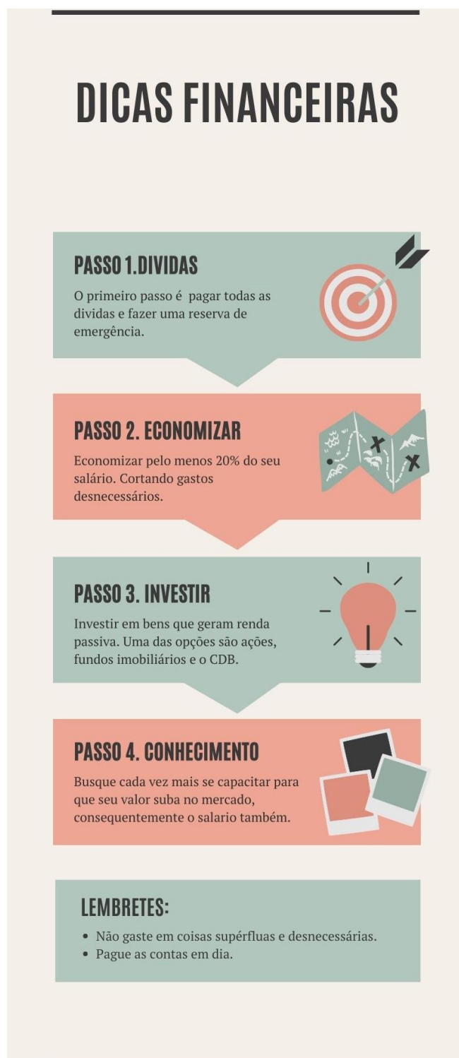
Figura 7: Banner sobre Dicas Financeiras