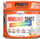
IMMUNO SHOT® Sua dose diária de imunidade