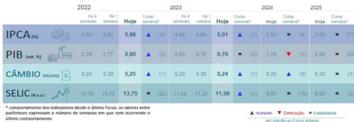
FIGURA 3 - MEDIANAS DAS EXPECTATIVAS DE MERCADO