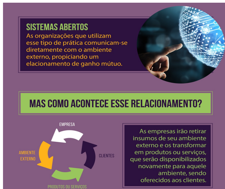
FIGURA 4 - SISTEMA ABERTO

Greves, guerras, mudanças políticas, aumento no combustível, inflação, desvalorização da moeda, são fatores que influenciam diretamente a produção e venda dos produtos não só da empresa estudada, como em qualquer segmento industrial e empresarial.