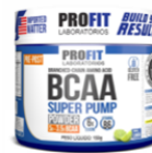
BCAA 6:1:1 SUPER PUMP POWDER