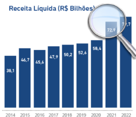
Figura 2 – Receita Líquida