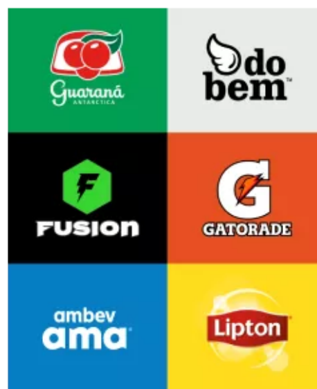
Figura 1 – bebidas alcoólicas e não alcoólicas.

Marcas de bebidas mais apreciadas – Não alcoólicas