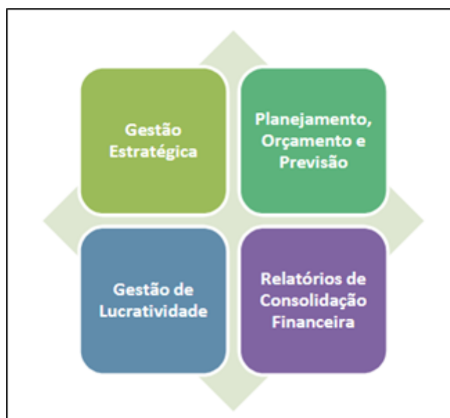
Figura 1 - Blocos funcionais do Hyperion

De acordo com Planello (2013) os diversos aplicativos do Hyperion podem ser reunidos em quatro blocos funcionais, conforme o quadro abaixo: