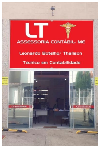
Figura 1: Exemplo de Estabelecimento Empresarial.