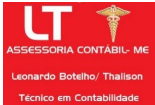
Figura 3: Exemplo de Marca de Renome.