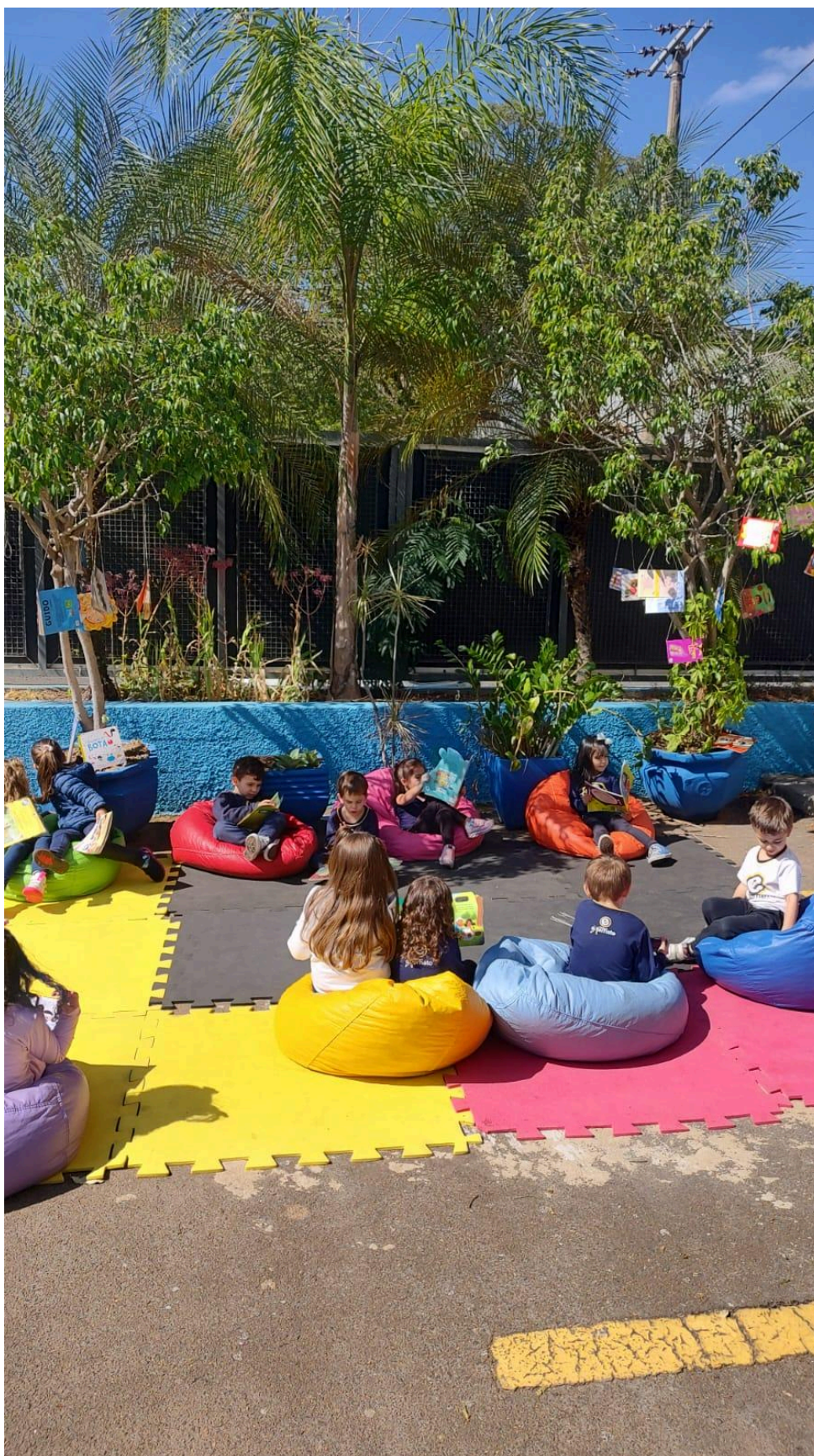
Fotos tiradas na escola Colégio Externato Educação Infantil.