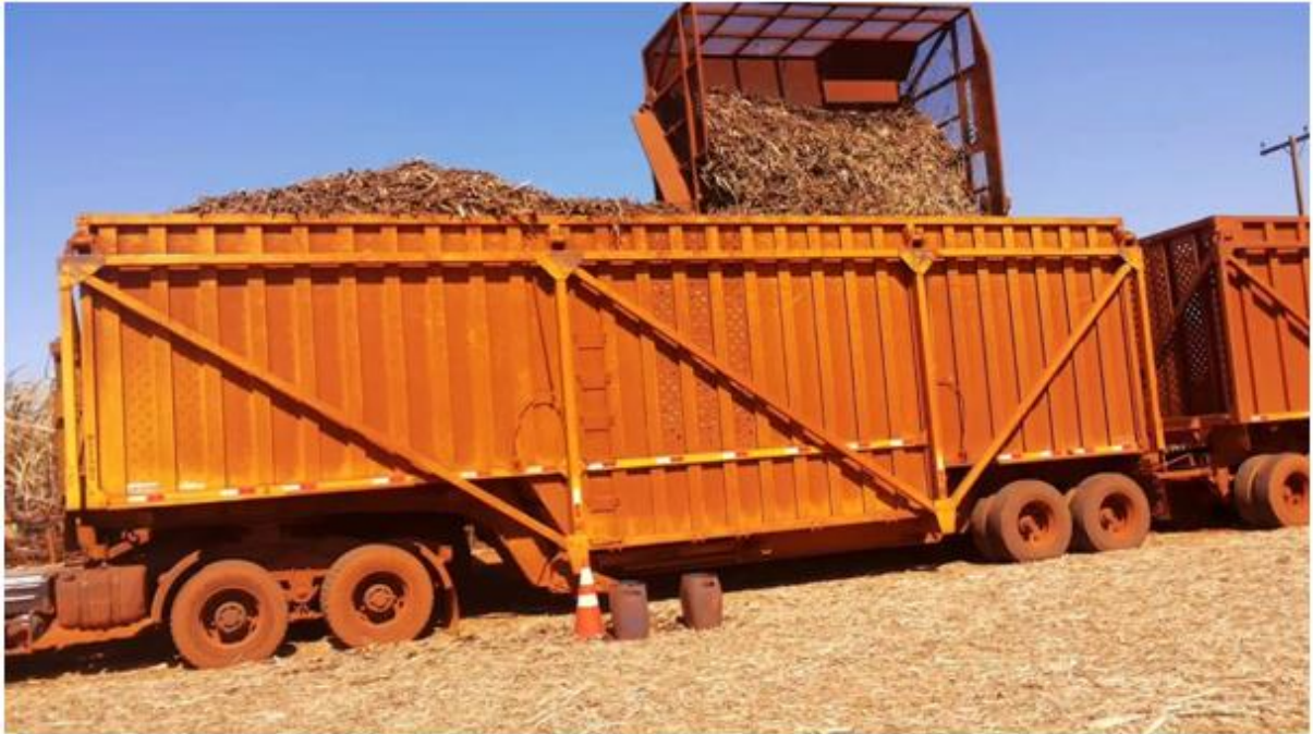
Figura 2: Transporte da Cana-de-açúcar