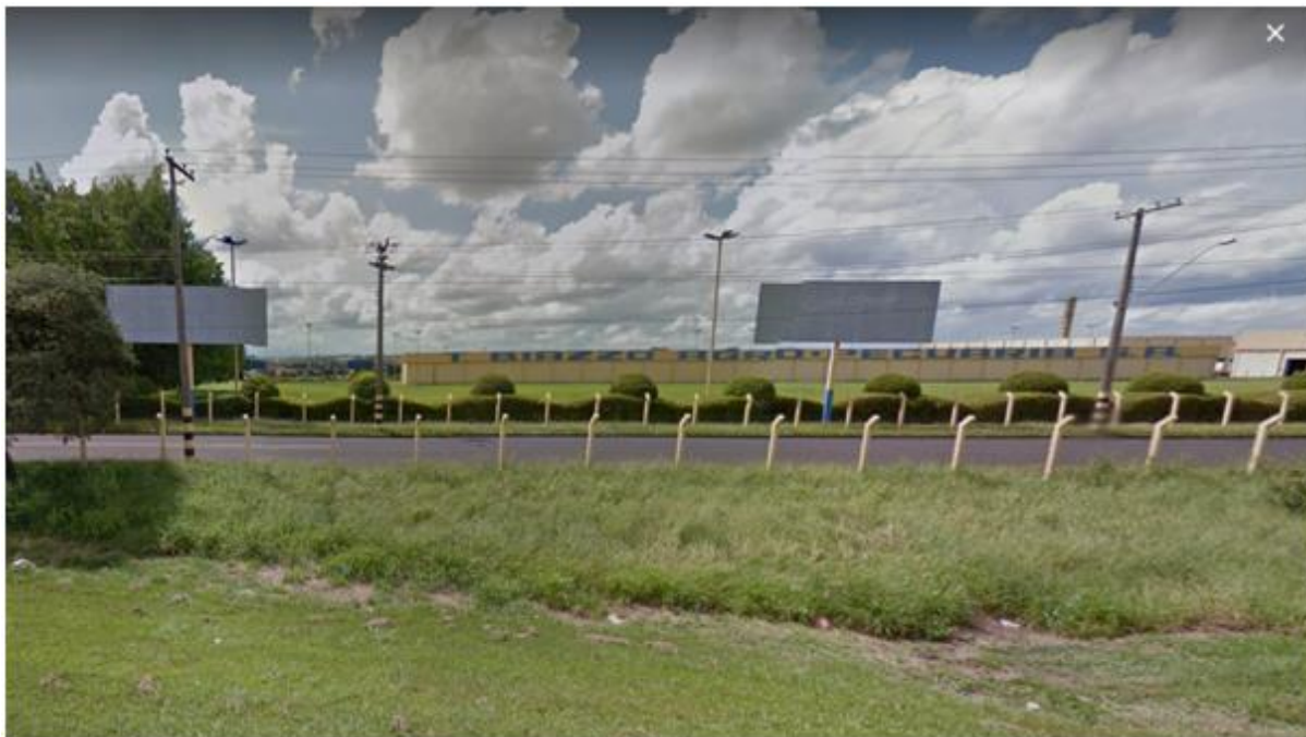
Figura 1: Galpão de armazenamento da empresa.