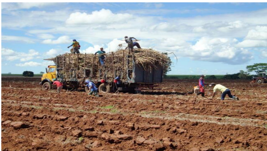
Figura 5: Plantio Manual da Cana-de-Açúcar