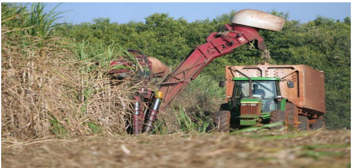
Figura 6: Colheita da Cana-de-Açúcar

O processo produtivo final da empresa é a colheita, como dito anteriormente em outro capítulo, este processo é negociado no ato da venda da cana a fim de evitar e repassar o trabalho deste processo. A usina compradora dos produtos faz o corte das canas com colhedoras (imagem abaixo) e equipamentos mecanizados com tecnologia que facilitam e agilizam a colheita da cana, transformando o processo mais viável e facilitado para a T Biazzo Agropecuária S/A.