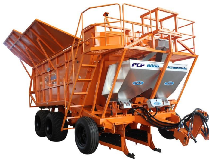
Figura 8: Plantadora de Cana Picada Automatizada

com tecnologia comandando o mercado agropecuário o mais ideal seria a implementação de uma máquina com uma tecnologia mais avançada, portanto, essa sugestão foi uma plantadora de cana picada automatizada, a qual apenas um funcionário conduz a máquina e verifica todo o seu funcionamento através de várias câmeras, realizando o processo com mais rapidez e eficiência.