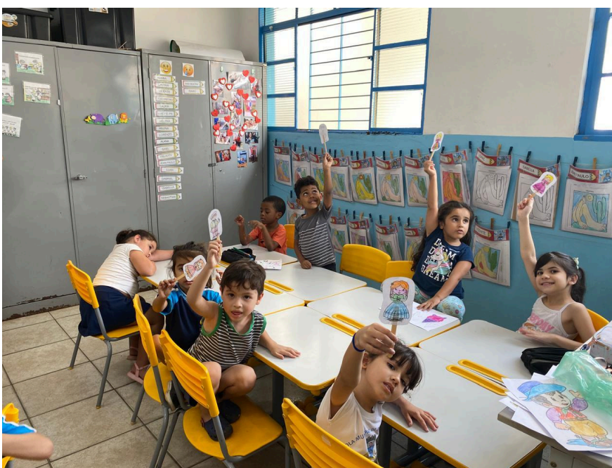
Crianças exibindo desenhos sobre a cultura Gaúcha após colorir.