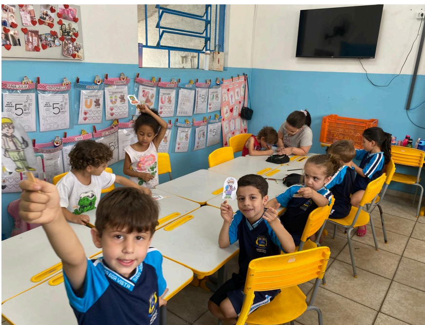
A foto captura não apenas o aprendizado, mas também a alegria e a colaboração entre os alunos, simbolizando a importância de se conectar com as tradições e raízes culturais.