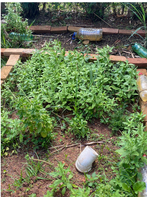
Canteiro da horta