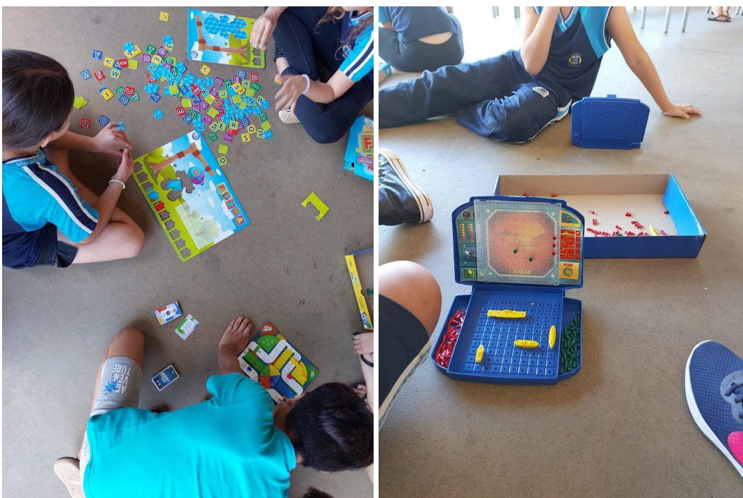
Visita na escola 24/10/2024 - crianças do 4ºano jogando na aula de Educação Física