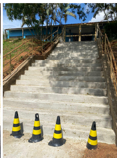
Escadaria em reforma