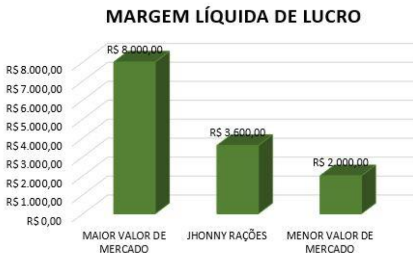
Figura 8: Margem Líquida de Lucro

Conseqüentemente, a mesma análise será realizada para a margem líquida de lucro, cuja média de mercado varia entre R$2.000,00 e R$8.000,00. Assim, a empresa Jhonny Rações demonstra um bom desempenho, com uma média de R$3.600,00, posicionando-se de forma competitiva dentro dos parâmetros do setor.