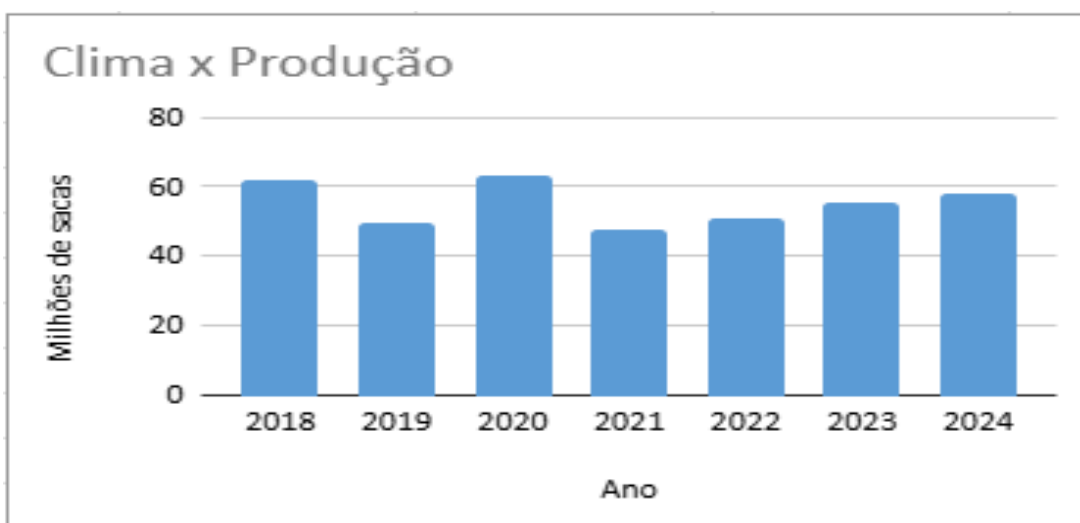
Gráfico 2 - Clima x Produção Nacional

Seguindo as informações do gráfico, em 2024 houve um aumento de 0,16% em relação ao mesmo período de 2023, como informado no item 3.4.2 acima.