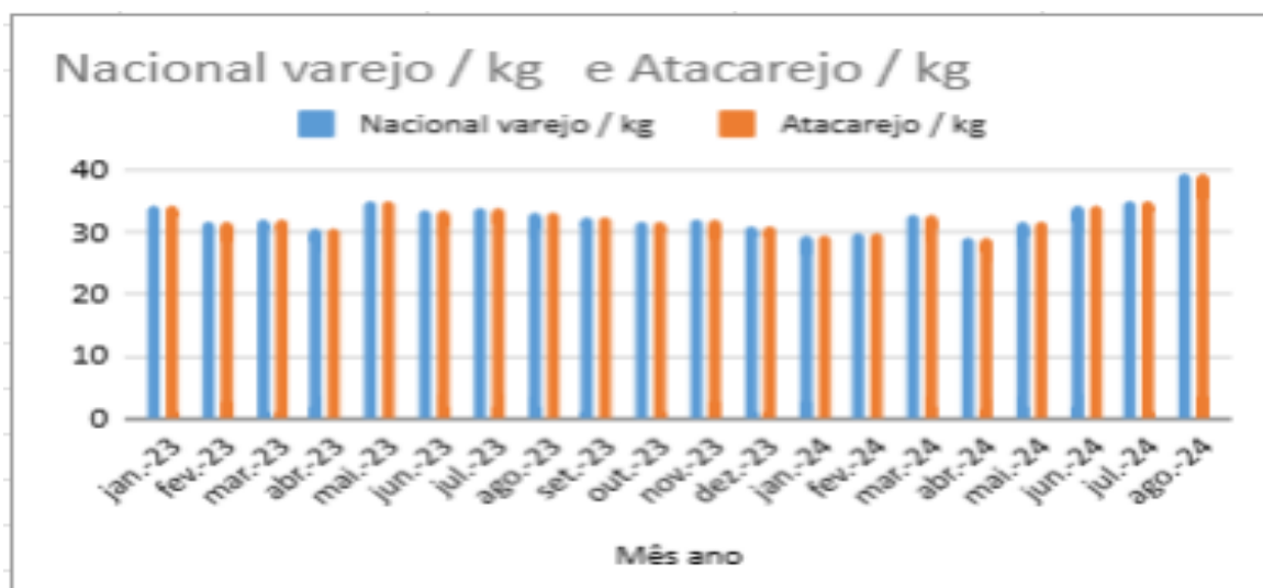
Gráfico 4 - Comparativo de Varejo e Atacarejo (Preço em Kg)

A figura representa as vendas de julho de 2023 a junho de 2024 dentro da empresa.