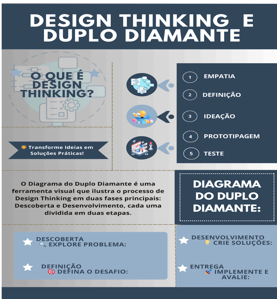
Imagem 22 - Banner sobre Design Thinking e Duplo Diamante:

Esse material destaca como o Design Thinking é uma abordagem centrada no ser humano para a resolução de problemas, explicando suas cinco etapas: Empatia, Definição, Ideação, Prototipagem e Teste junto ao duplo diamante.